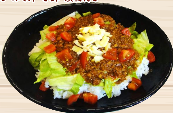
🌶️ タコライス ¥900