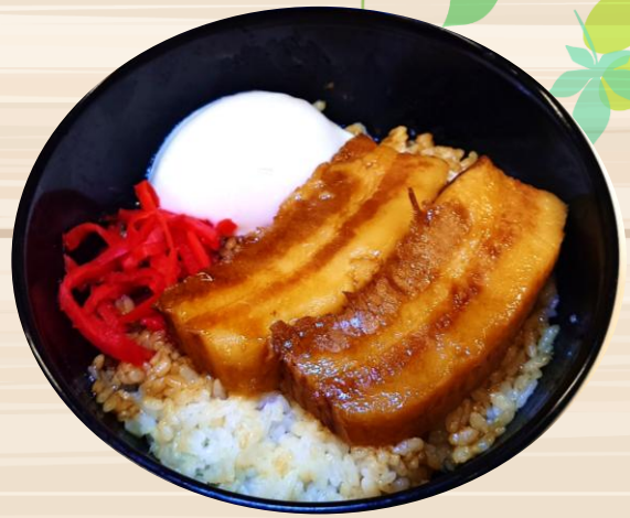
厚切り豚角煮丼 ¥950 みそ汁・漬物付き