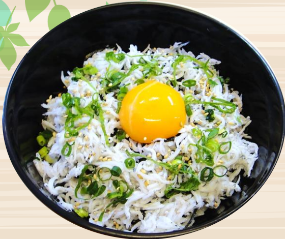
釜揚げしらす丼 ¥880 みそ汁・漬物付き